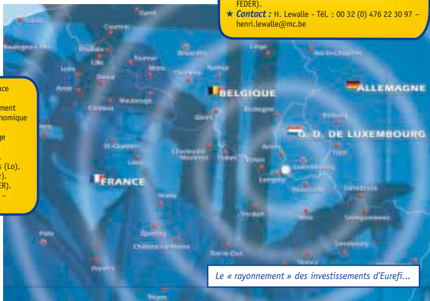
Le « rayonnement » des investissements d'Eurefi...

01/02 – 31/12/06. SNVB Participations (Lo), vest (W), IRPAC (Fr). t 2 927 500 € FEDER). 00 352 30 72 891 –