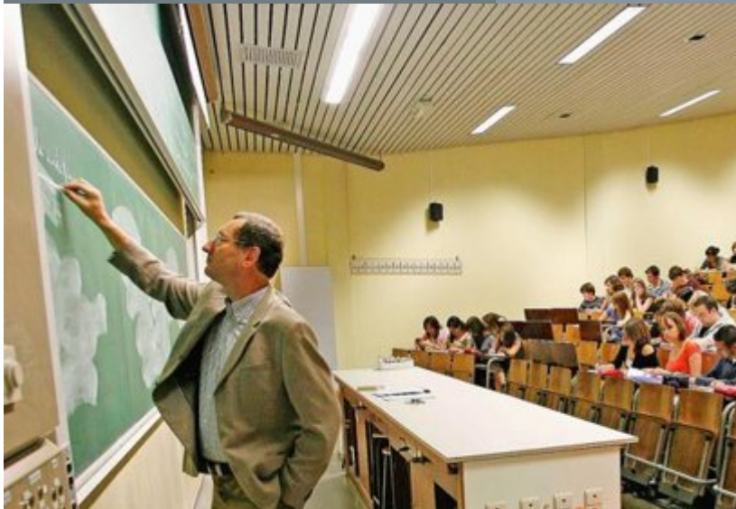
Le CDH namurois déplore la fusion ratée entre les FUNDP et l'UCL.